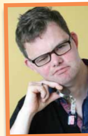
pag 34 De Kaai