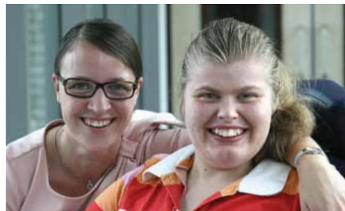
pag. 32-33 Hart voor Muiderheim Vrijwilligers aan het woord