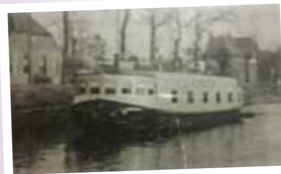
Een parlevinker was een ondernemer die vanaf zijn boot goederen -meestal levensmiddelen- verkoopt. In 2008 stopte de laatste parlevinker van Nederland.