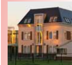
pag 22-23 ...naar nieuw