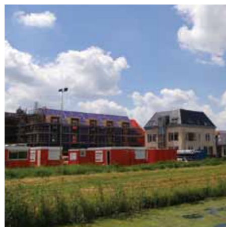
pag. 24 Bouw van een „uniek” project