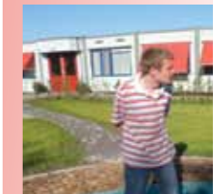
pag 20 van oud...