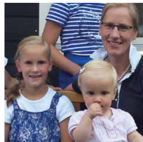
pag. 39 Een preek na de koffie