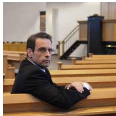
pag. 36 Zorg voor kostbare zielen