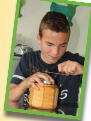
pag 31 De vaart