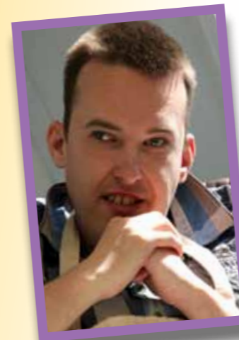
pag 12 Het Jacht