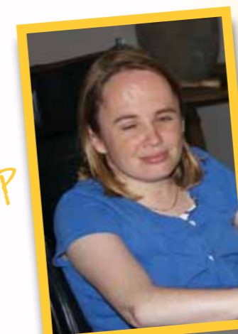
pag 30 Het veer