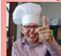
pag 08-09 Wonen op Muiderheim