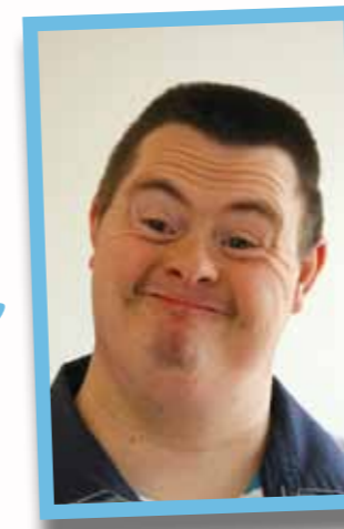
pag 37 De Sloep